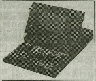
প্রথম ল্যাপটপ গ্রিড কম্পাস